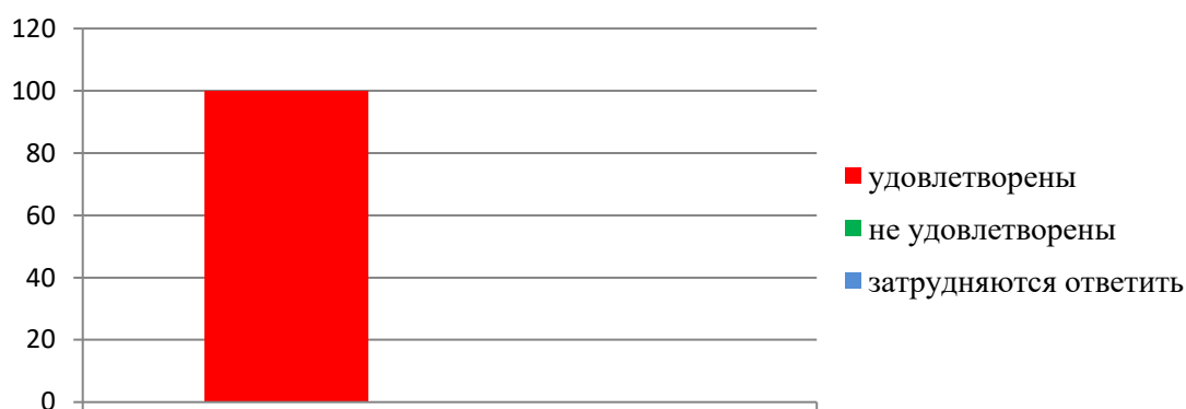
Рис. 1 Удовлетворенность комфортностью условий осуществления образовательной деятельности

По результатам анкетирования 100% респондентов удовлетворены комфортностью условий, в которых осуществляется образовательная деятельность в колледже.